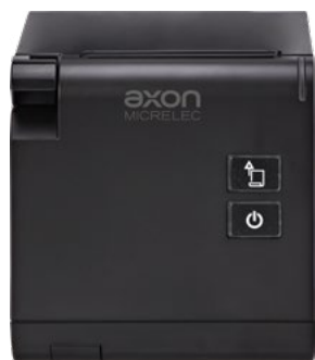
Uscita carta frontale