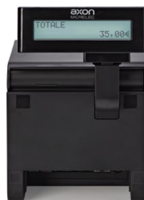
Display cliente integrato