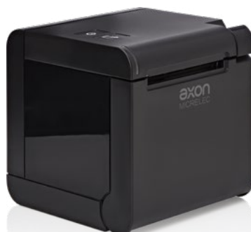
Uscita carta superiore